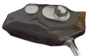
CAPACITA' 22 LT Codice SFT5348-06

Per tutte le versioni a richiesta può essere fornito un sensore di livello VDO completo di strumento di lettura