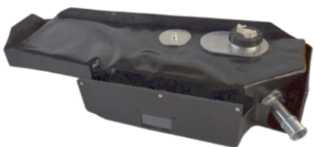
CAPACITA' 30 LT Codice SFT5347-06