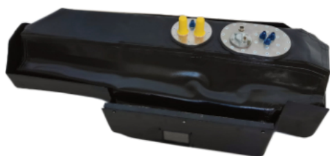
CAPACITA' 45LT Codice SFT5524-06

VEETTURA PEUGEOT 106/CITROEN SAXO GR. N - Sede Originale - Sotto Telaio